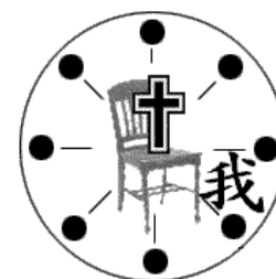
有目标基督管理的生命