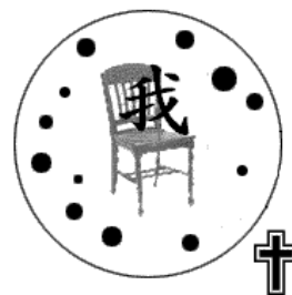
紊乱自我管理的生命

接受基督包括自我转向神（ 悔改 ），相信基督进入我们的生命，赦免我们的罪，使我们成为合神心意的人。人只在理智上同意关于基督的真理，或只有一些情感的经验，都是不够的。我们必须藉着信心（ 意志的行动 ）去接受基督。下面两幅图画，你选择那一个呢？